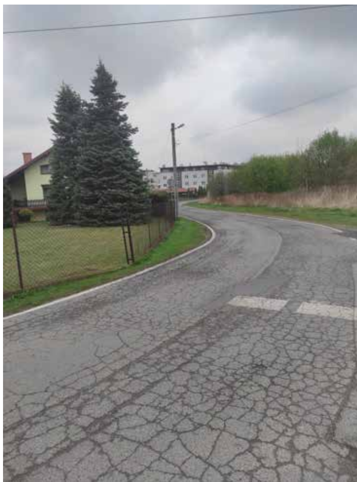
Fot. 3 Widok na skrzyżowanie ul. Borowinowej z ul. T. Chałubińskiego