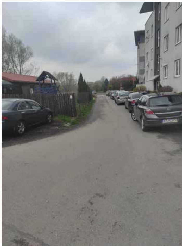
Fot. 8 Istniejące zagospodarowanie w rejonie zjazdu na ul. Babiego Lata