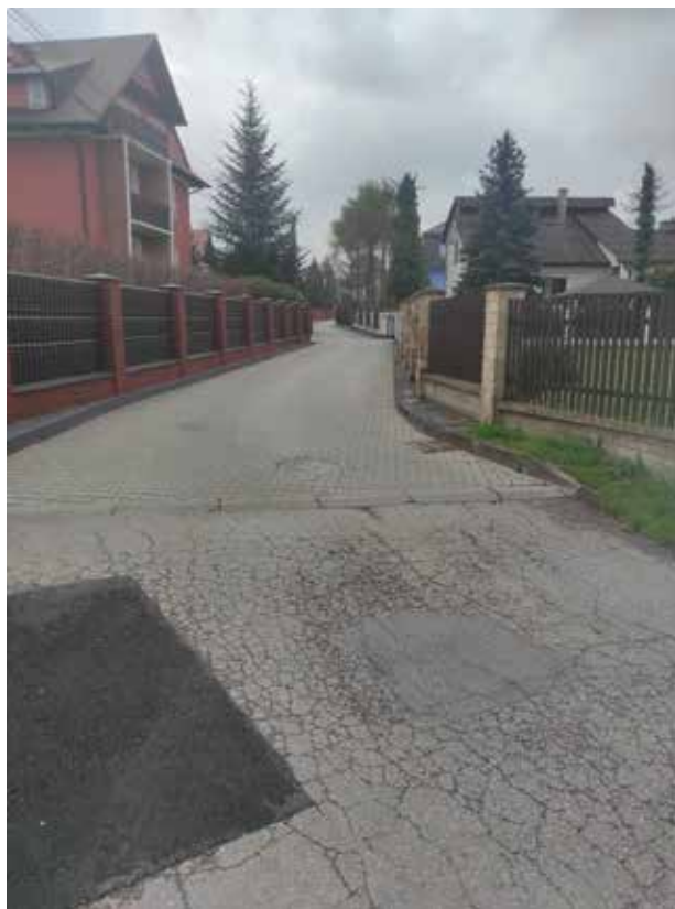
Fot. 4 Widok na ul. T. Chałubińskiego