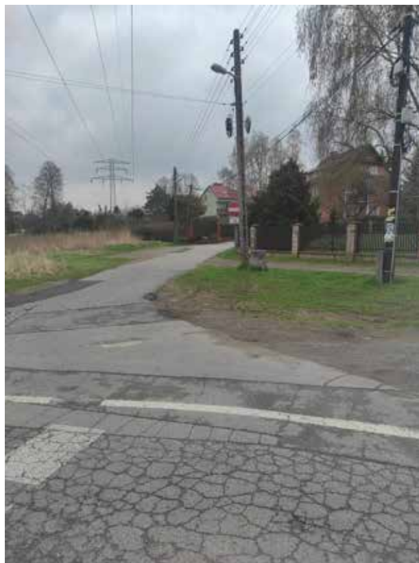
Fot. 2 Widok na skrzyżowanie ul. Borowinowej z ul. T. Chałubińskiego