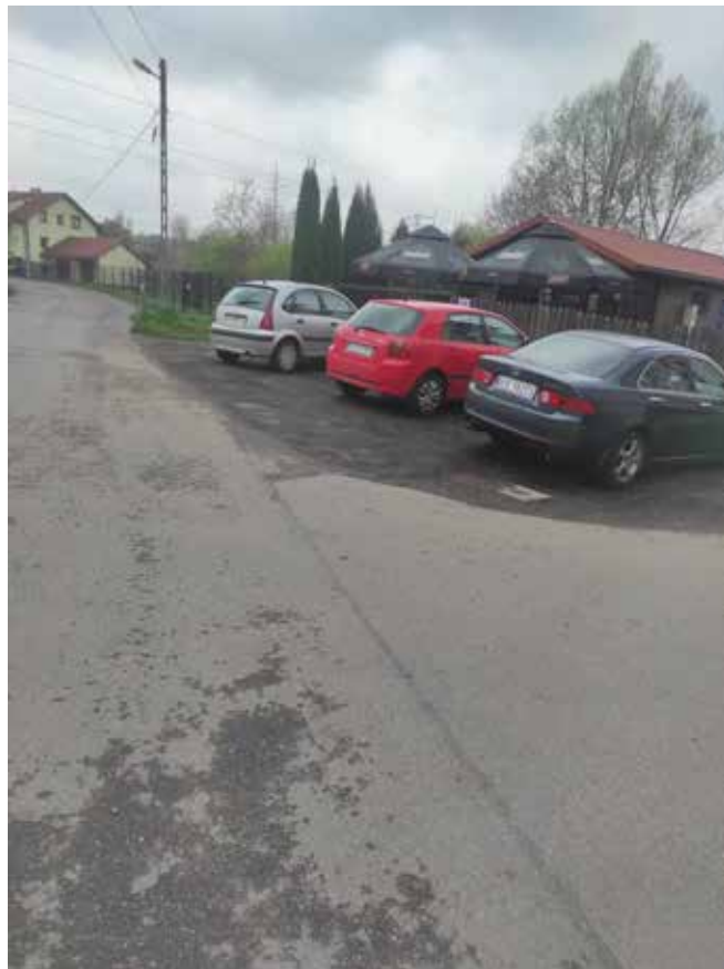
Fot. 7 Istniejące zagospodarowanie w rejonie zjazdu na ul. Babiego Lata