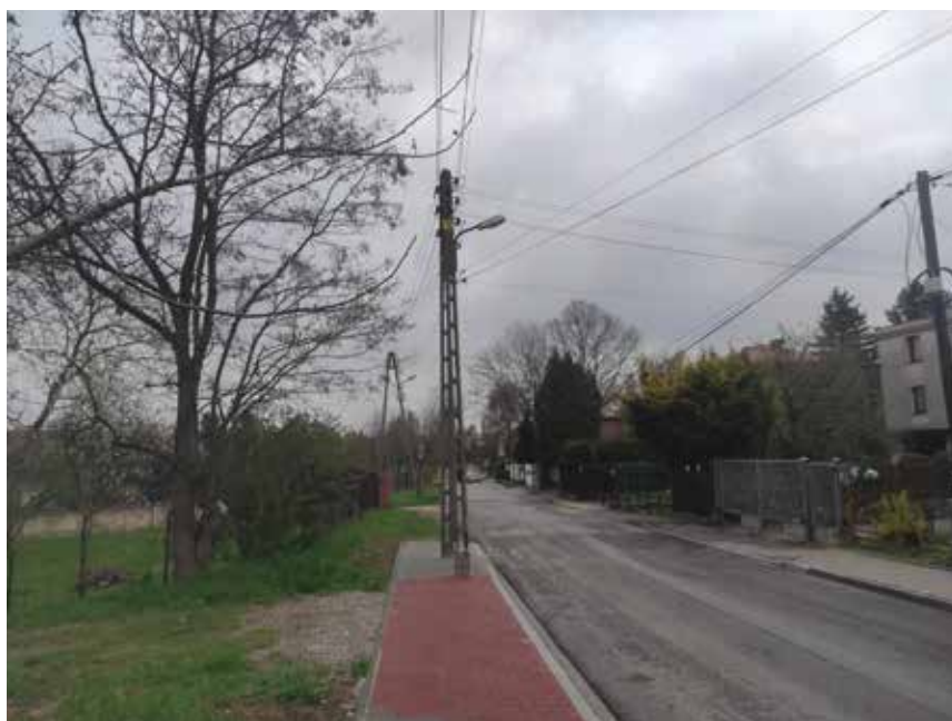
Fot. 1 Widok na początek opracowania na ul. Borowinowej