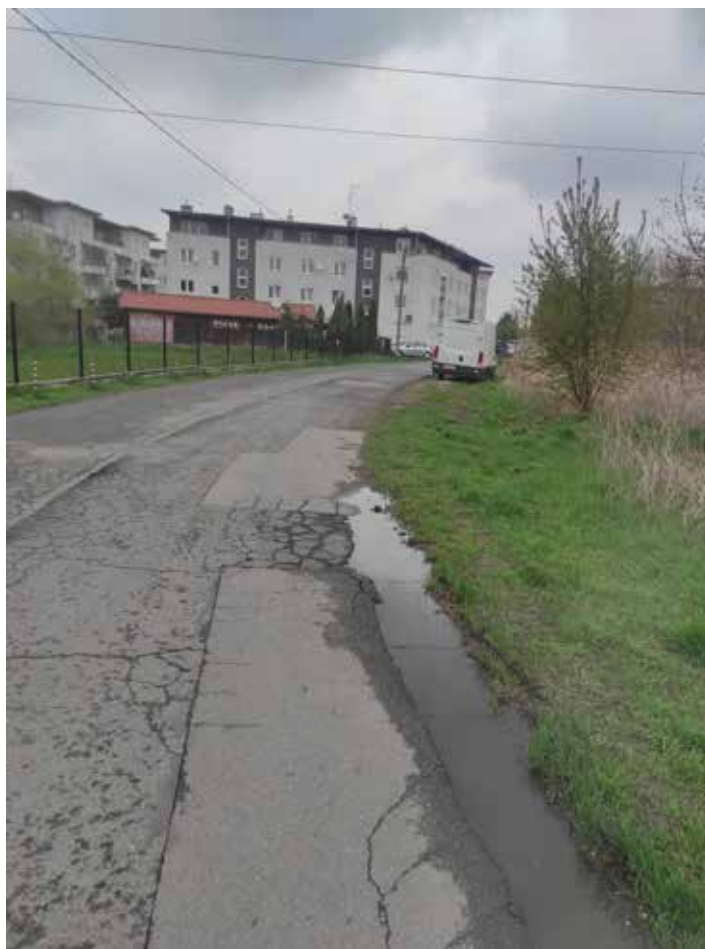
Fot. 5 Istniejące zagospodarowanie ul. Borowinowej