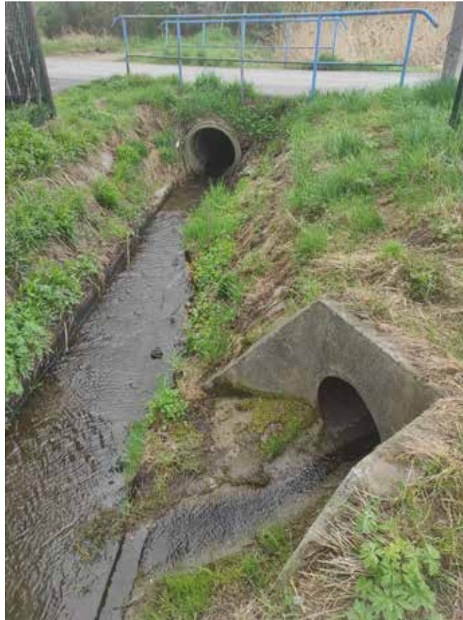
Fot. 6 Istniejące zagospodarowanie w rejonie przepustu